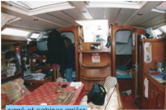
carré et cabines arrière

Batteries : 3 Chargeur Ligne de quai Installation 220 V