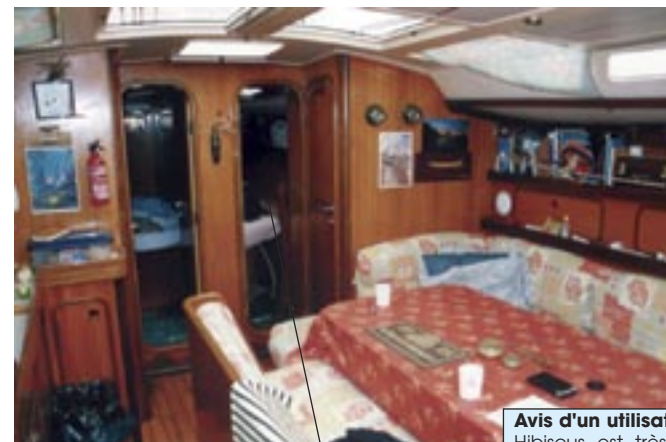
carré et cabines avant