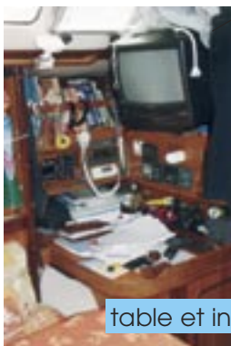
table et instruments

BATEAU: HIBISCUS ANNEE: 1990 TYPE: OCEANIS 430 1ère Catégorie