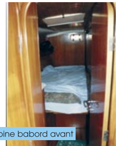
cabine babord avant

Four Glacière Eau sous pression Eau chaude Douche 2WC Table de cockpit Jupe Douche de pont fixe Réservoir d'eau environ 600 l